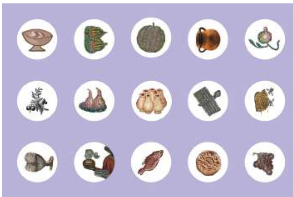
Ένα (1) αντίγραφο πήλινης σφραγίδας άρτου ευλογίας με επιγραφή: Κ(ύρι)ε βοήθ(ε)ι Γιόργι(ν), δος αιώνας, Νικόπολη Πρέβεζας, Αρχαιολογικό Μουσείο Νικόπολης, αρ. ευρ. 1953